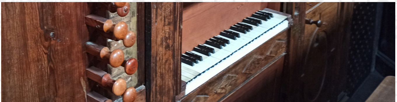
Vista del teclado del órgano histórico de Villanueva de Huerva.

El contenido del concierto se plantea como un recorrido a través del calendario litúrgico y algunas de sus principales celebraciones en el que los tintos de lleno, partidos, de falsas y tocatas se acompañan de música compuesta en el ámbito aragonés para cada tiempo. Da comienzo en la Cuaresma, con una versión del himno Vexilla Regis de la segunda mitad del siglo XV, de autoría incierta aunque atribuible a García Baylo (fl. 1463-1474) o Pedro Pifant (fl. 1476), ambos personajes vinculados con la Capilla de Música de La Seo de Zaragoza. Se trata de la obra polifónica más antigua conservada en los territorios de Aragón, y fue cantada durante siglos en los días previos al Triduo Sacro en diversas funciones.