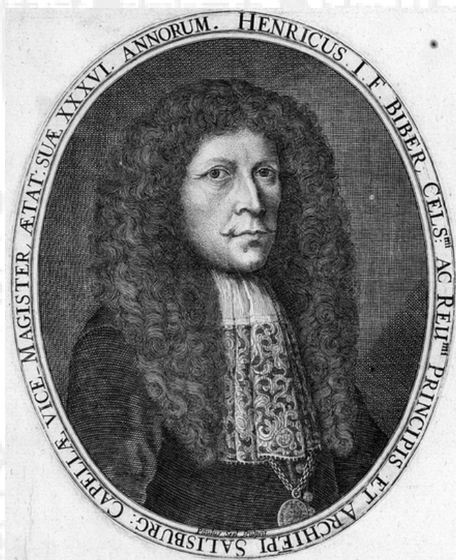
Retrato de Biber.

A primera vista, las llamadas « Sonatas del Rosario » (la colección carece de portada, por lo que se desconoce cómo quería llamarlas Heinrich Ignaz Franz von Biber) reúnen todos los requisitos de una obra maestra: un tema general, una estructura cuidadosamente pensada y una gran calidad. La principal motivación de su concepción fue complacer al arzobispo Amilan Gandolph von Kuenburg, patrón de Biber en Salzburgo y fundador de la Cofradía del Rosario. Es probable que las piezas se interpretaran por separado en Salzburgo durante el Mes del Rosario (octubre), cuando, al anochecer, se recitaba uno de los tres grupos de misterios del Rosario (los Cinco Misterios de la Alegría, los Cinco Misterios Dolorosos y los Cinco Misterios Gloriosos). Las piezas consisten en su mayoría danzas (por lo que deberíamos hablar de «Suites del Rosario» en lugar de «Sonatas»), una característica notable en un contexto sacro. Esta relación antagónica puede aparecer incluso como una «sacralización» de digresiones expresivas, sensuales y virtuosas; en cualquier caso, pone de manifiesto una clara toma de posición por parte del compositor.