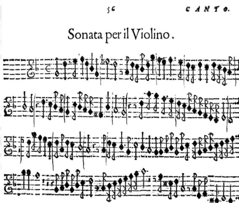
Edición facsimil de la Sonata violino e violone (1610) de G.P.Cima

La Sonata violino e violone de Giovanni Paolo Cima, representa el ejemplo más antiguo de sonata para violín con acompañamiento de bajo continuo. Fue publicada en sus Concerti ecclesiastici de 1610, y ya posee todas las características antes citadas del nuevo estilo violinístico. Cima fue miembro de una destacada familia de músicos con origen en Milan. Aunque el violín fue el protagonista de la música instrumental italiana en el siglo XVII, hubo compositores que dedicaron obras a otros instrumentos como solistas. Este es el caso del veneciano Giovanni Battista Riccio, que publicó tres libros de música que recogen diversas canciones para flauta de pico. Nosotros hemos escogido una que incluye Il terzo libro delle Divine Lodi de 1620.