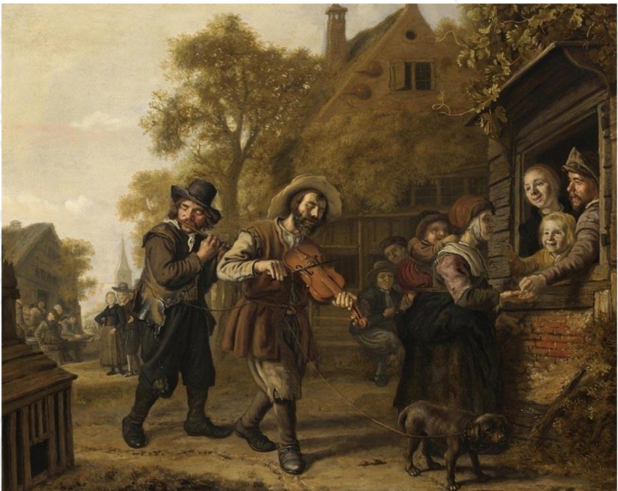
Jan Victors: El violinista ciego (1652)

Durante la primera mitad del siglo XVII, la música instrumental amplió sus funciones y cambió apreciablemente su técnica y estilo. Este cambio, iniciado en Italia, llegó pronto a Alemania y se extendió a Inglaterra, Francia y España. Por la contra, en los Países Bajos no había un estilo musical consolidado y tampoco llegaron estos cambios con fluidez. De hecho, no tuvo compositores destacados hasta después de la década de 1630. Pero desde 1640 Ámsterdam fue un lugar de afluencia de diversos estilos nacionales en forma de canciones y piezas instrumentales que los compositores neerlandeses recopilaban y publicaban. El siglo XVII terminó por ser el siglo de oro de las artes neerlandesas. Entre estas colecciones musicales, las más populares y que tuvieron una amplia circulación estaban los dos volúmenes de Paulus Matthyisz titulados T'Uitnemend Kabinet (1646-1649) y Der Fluyten Lust-Hof de Jacob van Eyck (1648). En estos libros se recoge música instrumental de toda Europa, mayoritariamente danzas.